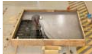
上部基礎コンクリート打設