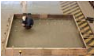
下部基礎コンクリート打設