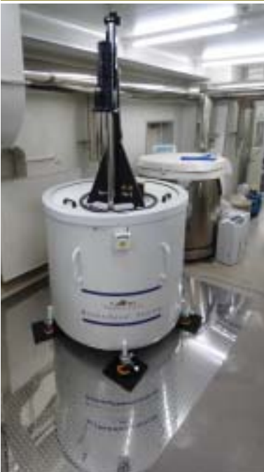
血液保存装置 (東京臍帯血バンク)