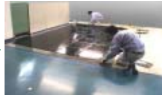
変形吸収部の敷設