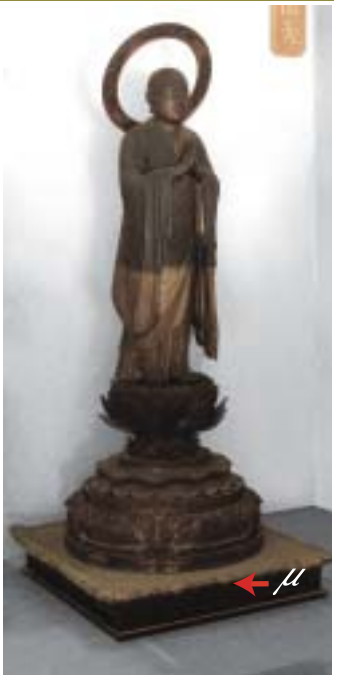
仏像 (京都市・西光寺)