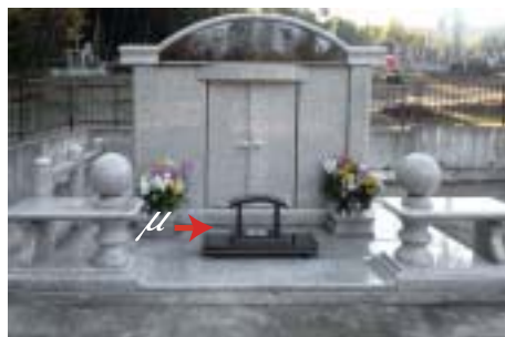
納骨堂 (千葉県・某宗教法人)