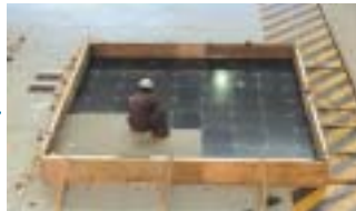
ミーソレーターの敷設