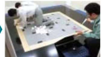
周辺部にカバープレートを設置