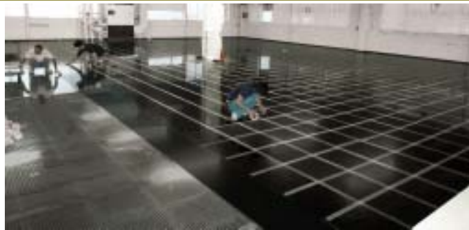
工場フロア (某大手通信材料メーカー)