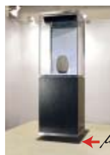
展示ケース(某福祉法人)