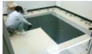
ミーソレーターの敷設