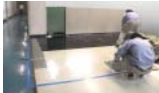
ミーソレーターの敷設